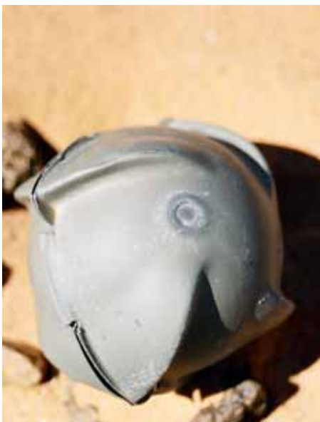
Vänster: Klusterbomb av typen BLU 63. Höger: Mata Mulana Sidi går igenom EOD (explosive ordnance disposal) träning.

– Som en enda stor sopstation. Så beskriver Mikaela Wallinder delar av den annars så vackra nordöstra delen av Västsahara. Där rensar Landmine Action tillsammans med Polisario området från framför allt klusterbomber.