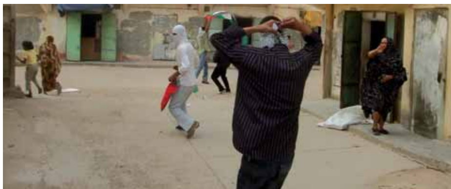
Demonstranter i Smara, februari 2008.