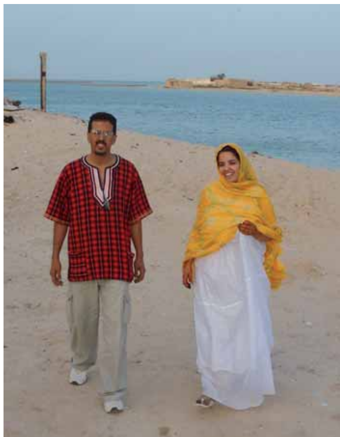
I Nouadhibou i norra Mauretaniens möts ibland västsaharier från flyktinglägren och från ockuperat område.

Med hjälp av Frankrike och ett ökat stöd av USA och FN:s säkerhetsråd har