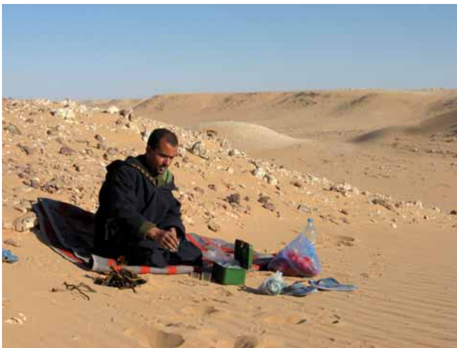
En utflykt till sanddynerna är avkoppling för den som kan ta sig dit.