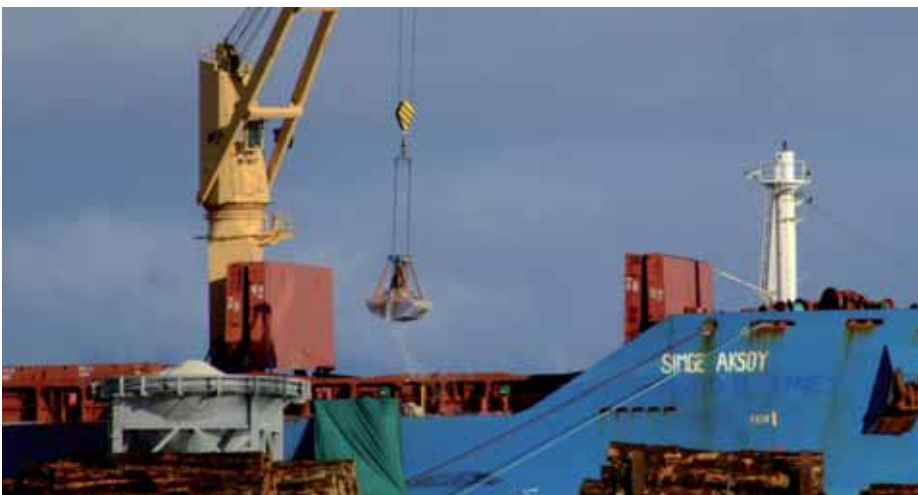
Simge Aksoy är chartrat av det norska rederiet Gearbulk och lossar här fosfat från Västsahara på Nya Zeeland den 23 juni.