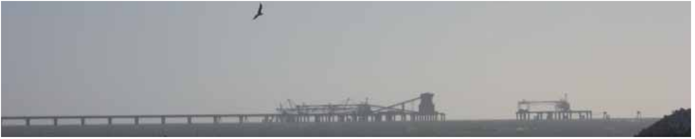
Utanför El Aaiúns hamn går transportbanden för fosfaten ut i havet, där det är tillräckligt djupt för fartygen, som lastar ombord stöldgodset för vidare transport.