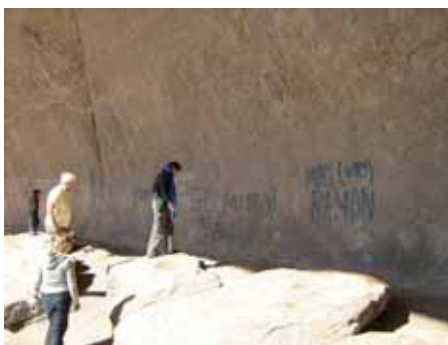
Förstörda klippmålningar.

Terrängen i den norra delen av den fria delen av Västsahara består av sand och grusslätter samt sandsten och granit. Förhöjningar består av kalk som är rik på fossil. Området är rikt på stora uttorkade flodfåror. Den nordvästra delen karaktäriseras av bergig terräng. Hållristningar förekommer rikligt och i många olika stilar, vilket tyder på en lång tradition. Den årliga genomsnittsnederbörden i denna