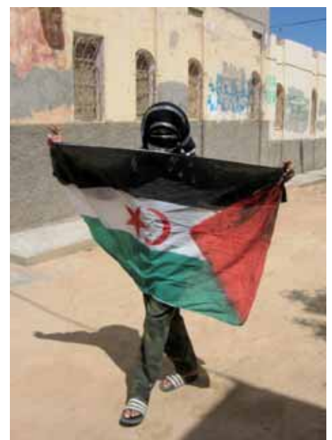
Det är förbjudet att visa den västsahariska flaggan. En ungdom passar på, när inga poliser syns till.