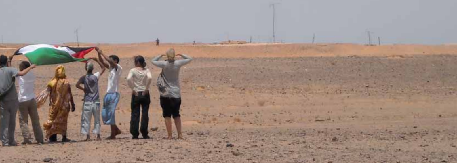
Nära muren, som marockanerna har byggt och som delar Västsahara i en västlig ockuperad del och östlig befriad del. Muren är cirka 200 mil lång. En marockansk soldat skimtar i bakgrunden.