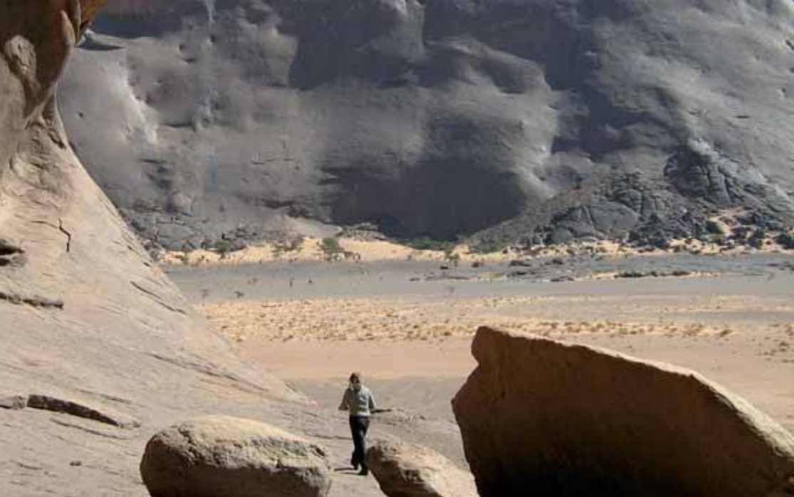
Sahara är inte bara sand. Granitklippor är prydda med 5 000 år gamla målningar, som har vandaliserats av FN-personal.