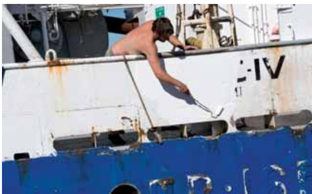
Nordic IV såldes i juni till norrmän.

Förvaltningen av fiskresurser i EU och globalt har havererat, dels på grund av piratfisket och dels på grund av politikernas oförmåga att hantera överkapaciteten i flottorna. I Sverige pågår nu ansträng-