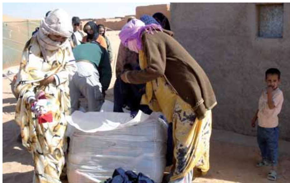
Bistånd levereras till flyktingarna.