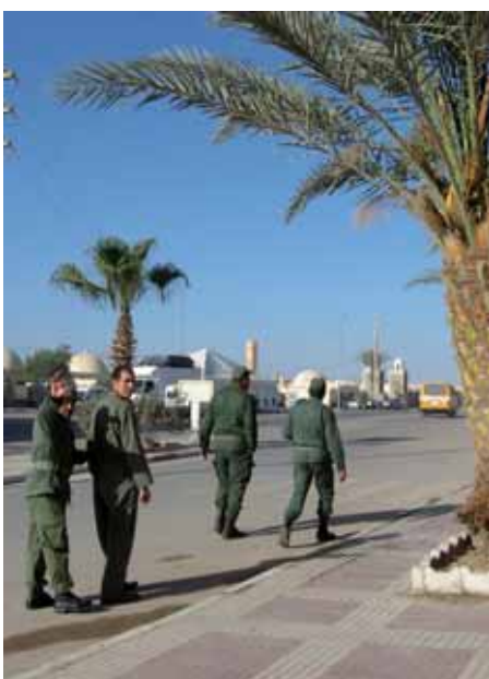
Ökenstaden Smara, nära den beryktade minnerade muren, är full av marockansk militär.

– Med bultande hjärta klev jag ur bussen. Det var då jag fick veta att min man var omgift. Han hade tvingats skriva under skilsmässopapper, tvångsgifts med