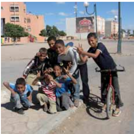
Västsahariska ungdomar i huvudstaden El Aaiún.

Utskottet konstaterar också att förhandlingarna mellan Marocko och Polisario varit resultatlösa.