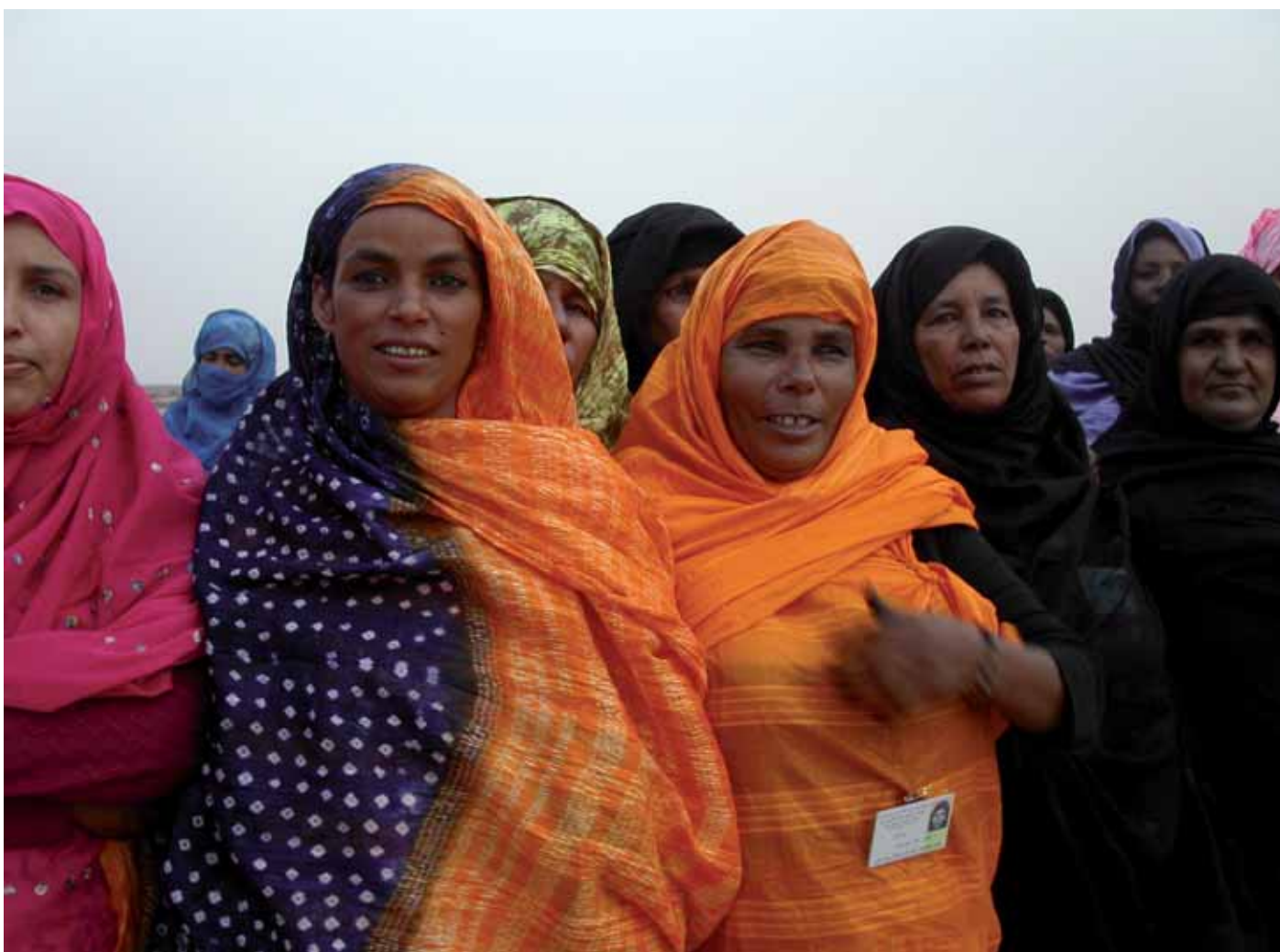
Västsahariska kvinnor i flyktinglägren.