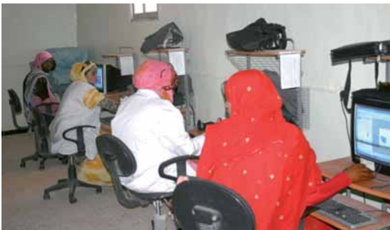
I Olof Palmeskolan utbildas cirka 100 kvinnor varje år.

människorättsaktivist som flytt det ockuperade Västsahara och nu bor i flyktinglägren. Det var när han för fem år sedan hade demonstrerat i västsahariska El Aaiún som han tillfångatogs och fängslades.