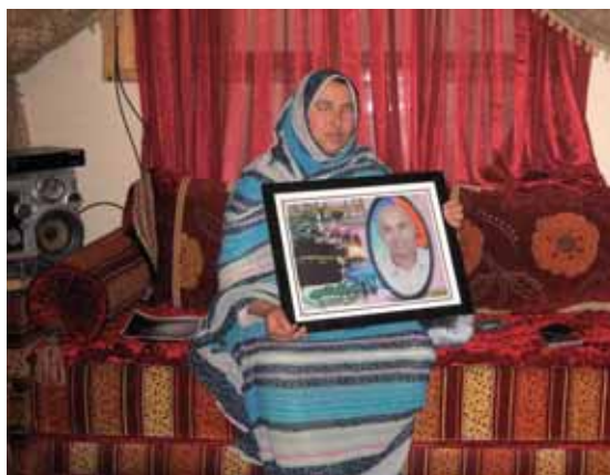
Syster till en ung man, som dog mystiskt.