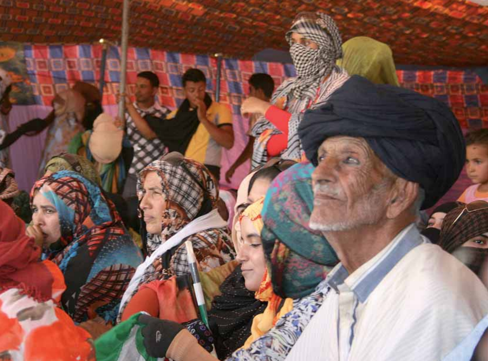
...stahariska organisationer för att stödja arbetet för fred och frihet.