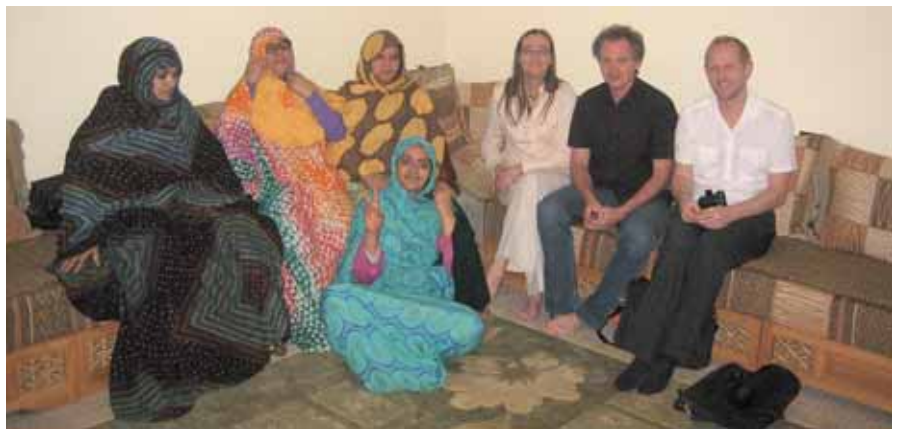
Släktingar till 15 unga män som försvann efter flykt mot Kanarieöarna 2005.

MINURSO:s betalda semester. Krigströttheten är stor och längtan efter en normal tillvaro i fred är stor på båda sidor. Människor lever med en stark och ständig militär närvaro i kombination med hög polisbrutalitet. Familjer är splittrade sedan 35 år tillbaka av en