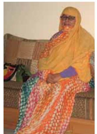
Anhörig till försvunna.

mur mitt i öknen. En mur som få i El Aaiún verkar ha sett i verkligheten. De marockanska myndigheterna bygger och investerar nu som aldrig förr i El Aaiún för att blidka EU och världssamfundet. Det finns de västsaharier som gynnas av detta, andra som accepterar det och är tysta men också väldigt många som vägrar att låta sig köpas. Den som är för regeringen kan få många förmåner, men den som har en annan politisk uppfattning har mycket svårt att få ett jobb eller ett värdigt liv.