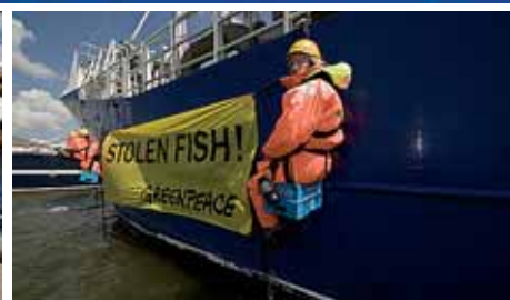
Greenpeace blockerade fiskefartyget Nordic IV i Göteborg 2008 på grund av dess illegala fiske i Västsahara.