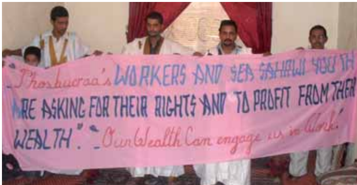
Västsahariska fosfatarbetare och fiskare protesterar mot plundringen av deras naturresurser.