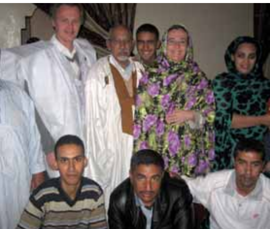
Möte med fackföreningsrörelser.

att få Västsahara fritt från Marockos ockupation. De tog oss till en familj som hade drabbats hårt av den marockanska polisen, då en familjemedlem dödats. Deras berättelse om händelsen var mycket gripande och känslös. Där träffade vi också anhöriga till dem som nu sitter fängslade efter Gdeim Izik, protestlägret som stormades av marockansk polis i november förra året.