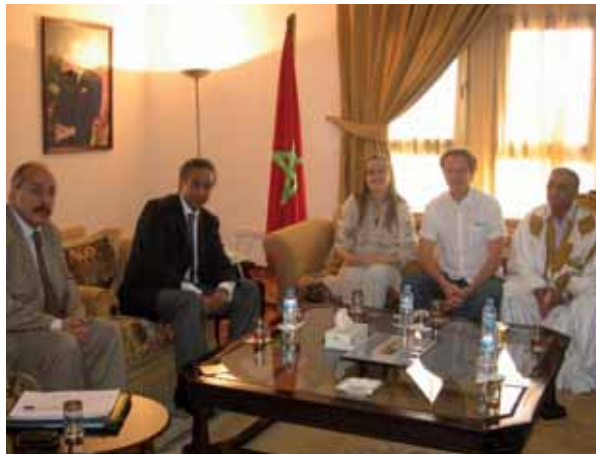
Hos guvernören och marockansk parlamentsledamot.