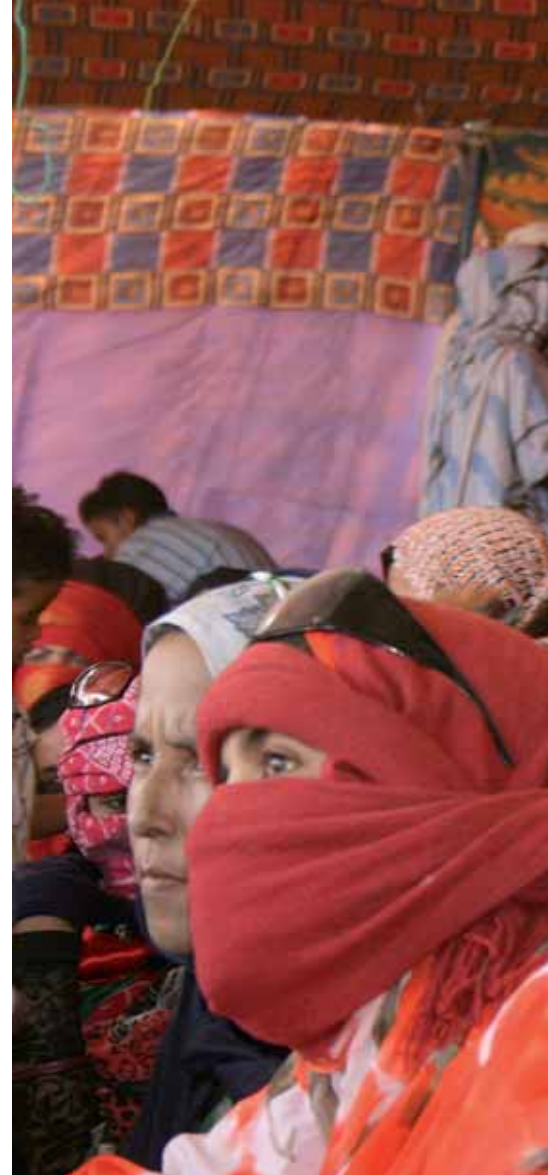
Palmecentret samarbetar sedan lång tid med olika västsahariska organisationer.

Västsaharierna som bor på ockuperat område lever i ständig skräck liksom de som