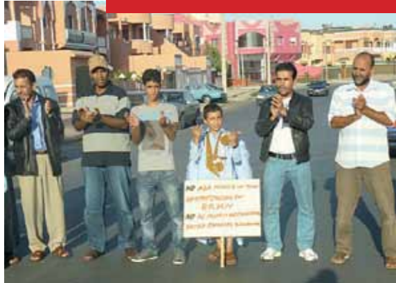
Västaharier i ockuperade El Aaiún trotsade militären och demonstrerade.