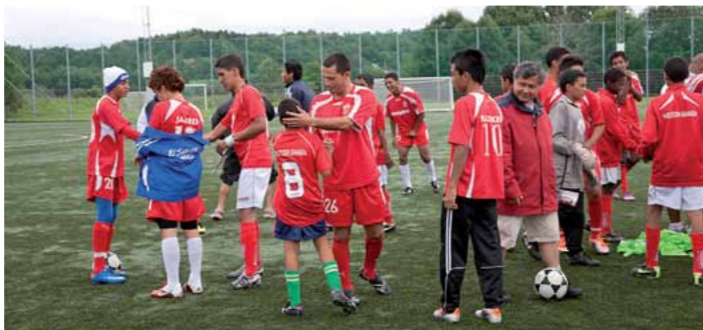
De västahariska pojkarna fick goda råd och stöd i mixade lag i en vänskapsmatch med Soyapango från El Salvador.

– Tanken med att bjuda in västahariska ungdomar till Gothia Cup är dels att erbjuda dessa ungdomar möjlighet att komma till Sverige, att få träffa ungdomar från hela världen, att få spela fotboll och att framför allt