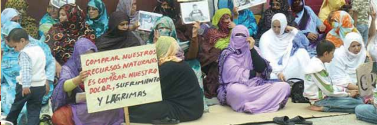
"Att köpa våra naturresurser är att köpa vårt lidande och våra tårar." Kvinnor i fredlig manifestation.