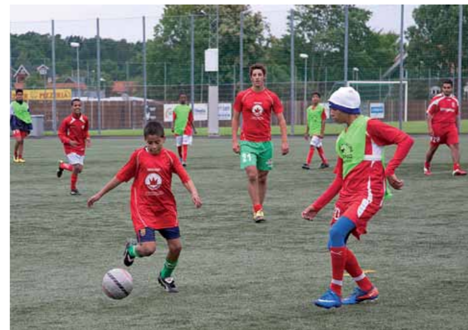
Inget fel på viljan trots ålderskillnad i lagen.