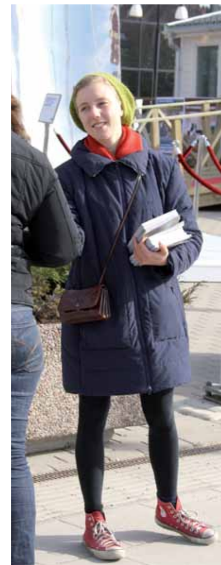
Flygbladsutdelning på turistmässan i Göteborg i mars.