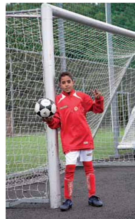
I flyktinglägren är spelförhållandena helt annorlunda.

Hama, 12 år, tycker att simbassängerna här är fantastiska. Dessutom längtar han efter morgondagen då hela laget ska åka till Vrångö och äntligen se havet. En helt ny upplevelse för barn som är födda och uppväxta i öknen.