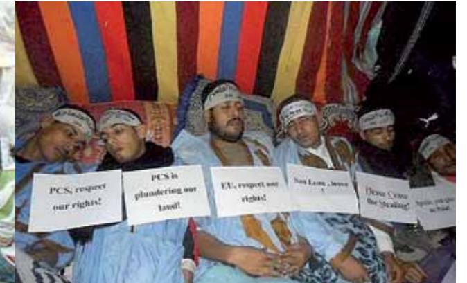
Västahariska politiska fångar hungerstrejkade i 67 dagar.