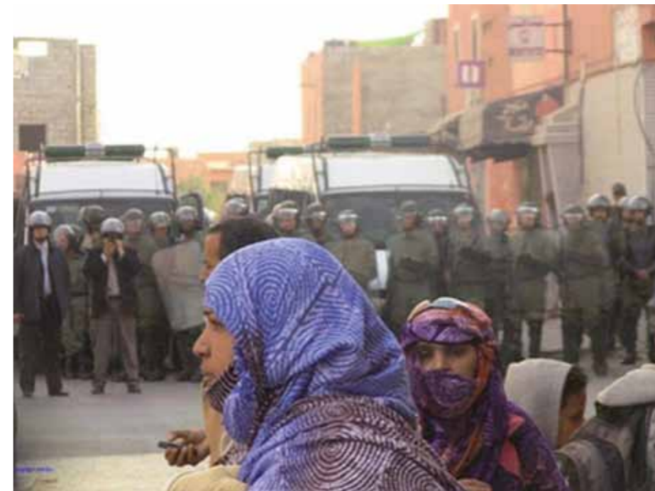
Marockanska poliser och soldater vid en manifestation i Smara i maj.

Jag har stämt möte med honom i bokhandeln Tuareg i småstaden Gran Tarajal