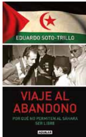
"Resa till försummel-sen" kom ut på spanska 2011.

Promarockansk lobby bildas. 1974 utsåg Franco Arias Navarro till premiärminister och sände förslaget om självbestämmande