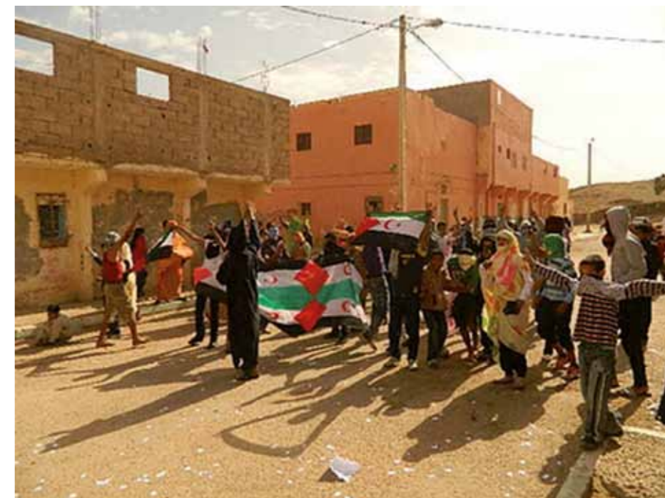
Manifestationer i den ockuperade staden Smara i maj.

– Det var paradoxalt att en del spanska militärer reagerade mot trepartsöverenskommelse. Först bekämpade de Polisario och se-