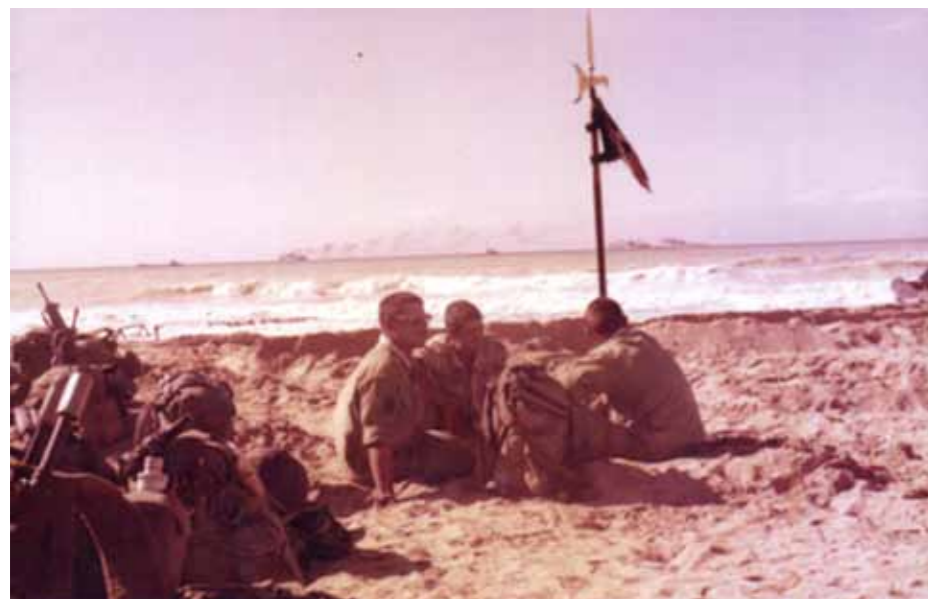
De sista spanska soldaterna väntar på stranden för överfart till Kanarieöarna.

Sveket. I Madrid hölls ett brådskande ministerråd med de högsta spanska militärerna från Spanska Sahara och enklaverna Ceuta och Melilla. Franco mindes det förflutna när han krigade i Nordafrika. "Vi ska ännu en gång besegra morerna", sa han. Det är intressant att Franco gjorde en skillnad mellan invånarna i Spanska Sahara och de