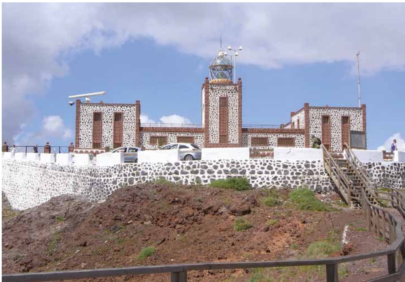
Från fyren La Entallada på Fuerteventura kan man vid klart väder se Västsaharas kust. Med radar kan man kontrollera båtar med fisk – och flyktingar.