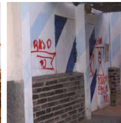
Människorätsaktivister i den ockuperade delen av Västсахara vågar visa flaggan.

på muséer, promenerar på huvudgatan och går på restaurang. Har ni något politiskt på er agenda så vill jag veta det. För er säkerhets skull. Nu åker ni direkt till ert hotell!"