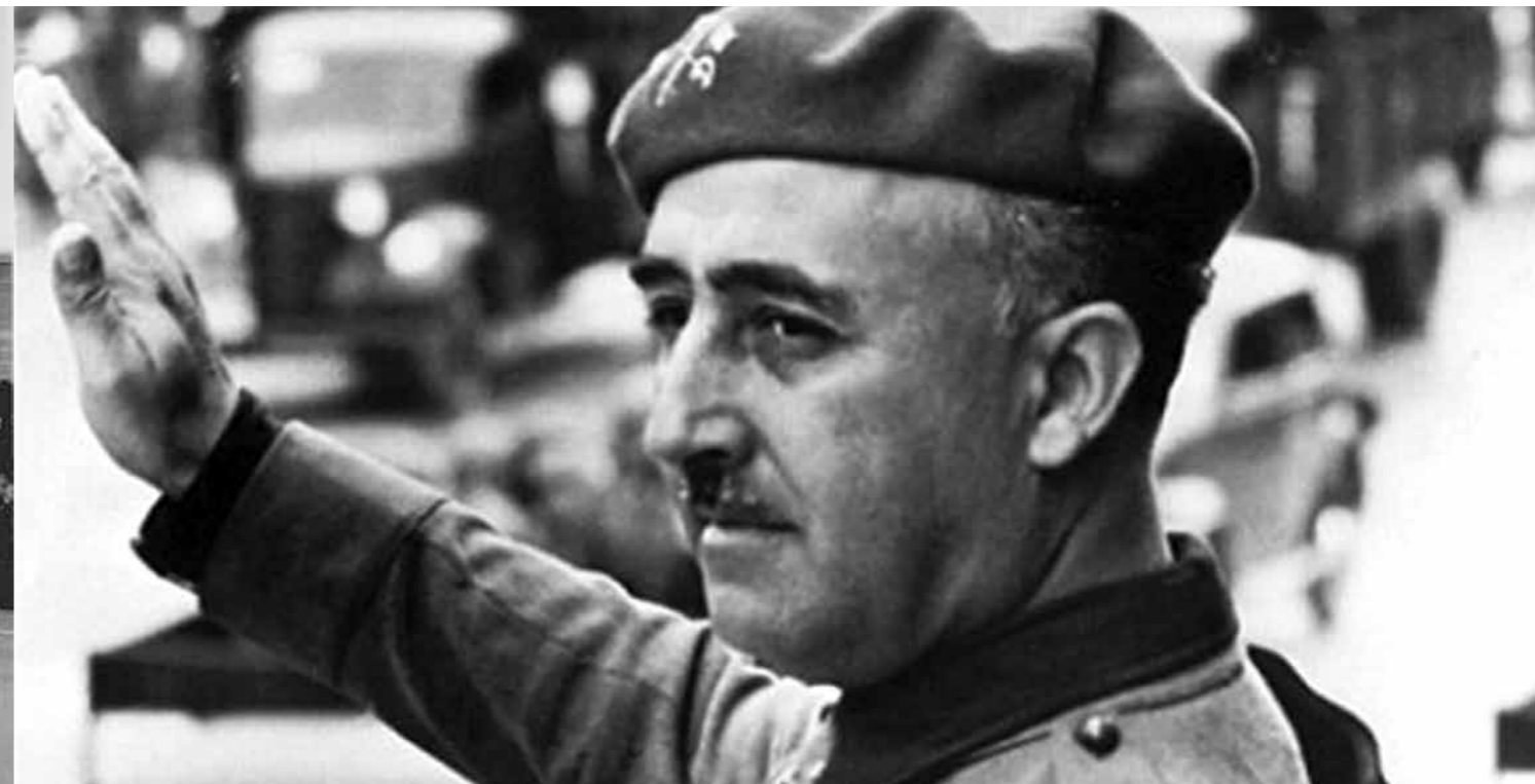
Spaniens diktator general Francisco Franco avled i november 1975.