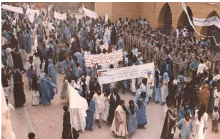
Demonstration till stöd för Polisario Front i El Aaiún 1975.

Trepartsöverenskommelsen. Den 14 november slöts den illegala trepartsöverenskommelsen i Madrid. Representanter från Spanien, Marocko och Mauretanien avgjorde västsahariernas framtid utan deras medverkan. Och om folkomröstning inte ett enda ord. Fördraget gav Marocko rätten att ockupera två tredjedelar av den norra delen och Mauretanien en tredjedel av den södra. Spanien fick behålla 35 procent av aktierna i fosfatgruvan samt fiskerättigheter.