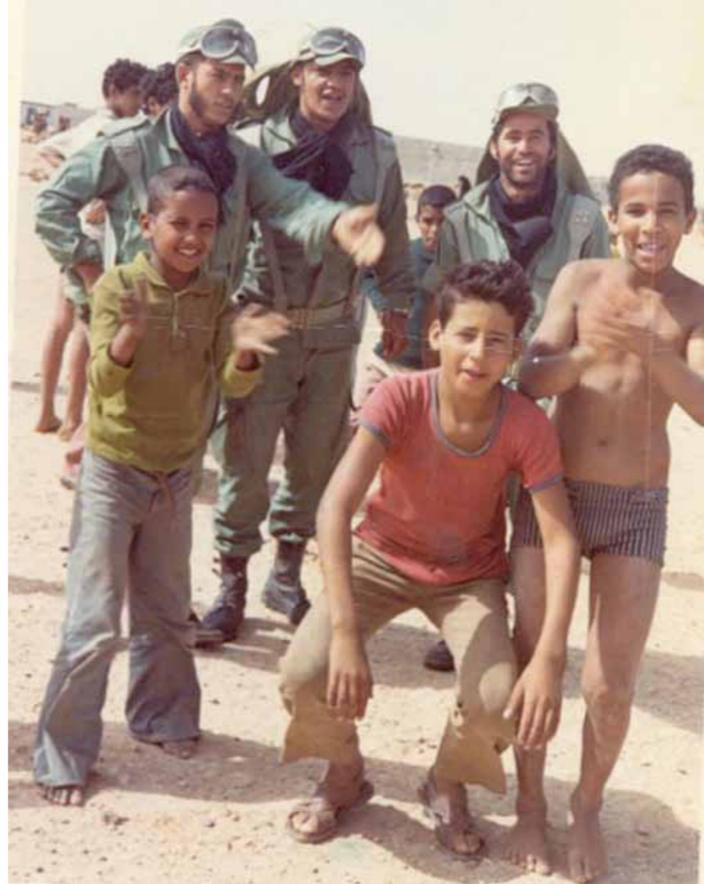
Spanska soldater och västsahariska (?) barn 1974 i Spanska Sahara.

till klanledarna i Yemaá som godkände det. Detta fick den desperata Hassan II att koncentrera trupper till den södra gränsen och i Marockos alla media manades till allmän mobilisering. Det rädde krigsstämning. Han sände även ett upprört och hästskt brev till Franco som fick en hjärtattack.