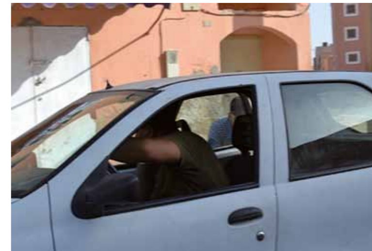
Efter övergreppen försöker de civilklädda poliserna dölja sin identitet.