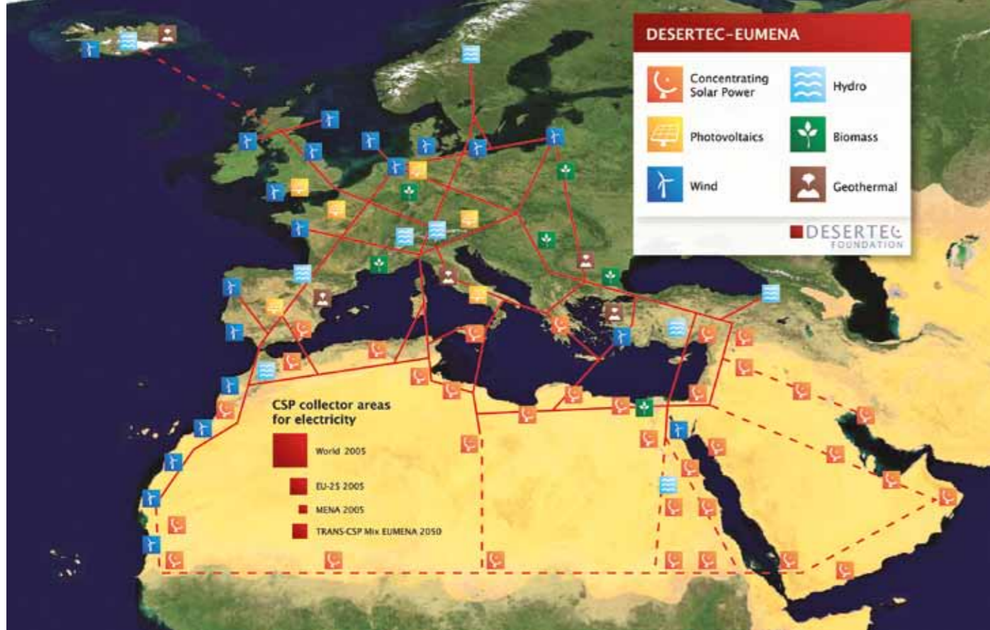
Desertecs storslagna planer för sol- och vindenergi från Mellanöstern och Nordafrika till Europa.