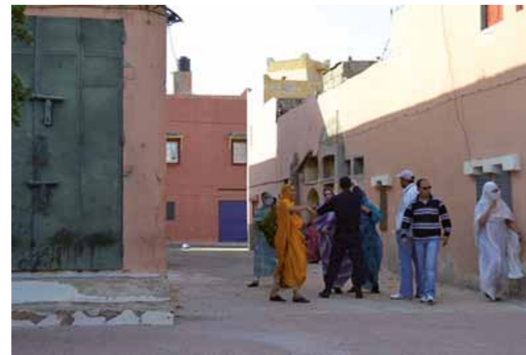
Attack mot fredliga demonstranter.