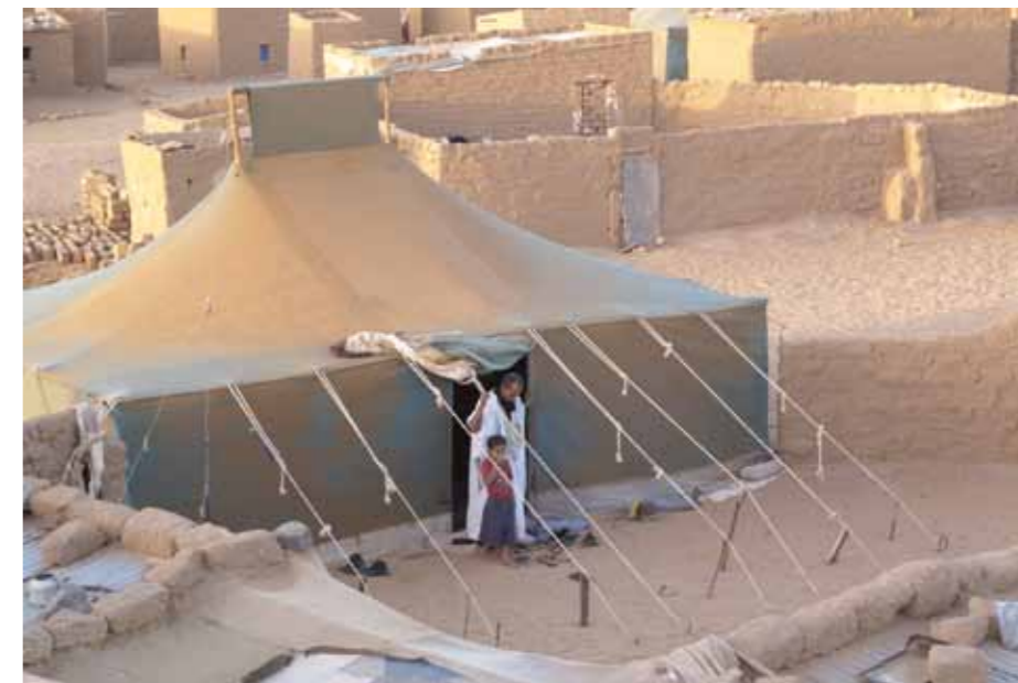
Långt från kungens palats bor de västsahariska flyktingarna i tältlägret Dakhla i Algeriet sedan 37 år.