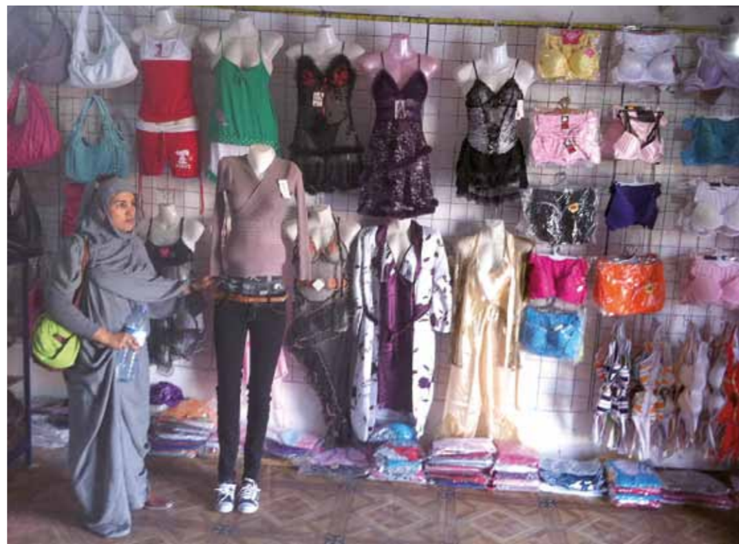
De unga kvinnorna i flyktinglägren har helt andra influenser än sina mödrar när de var unga.

Den nya generationen kvinnor har alltså vuxit upp med livsförutsättningar som skiljer sig starkt från deras mödrars ungdomsår. Men de sociala och kulturella förväntningarna på kvinnors beteende är desamma, och