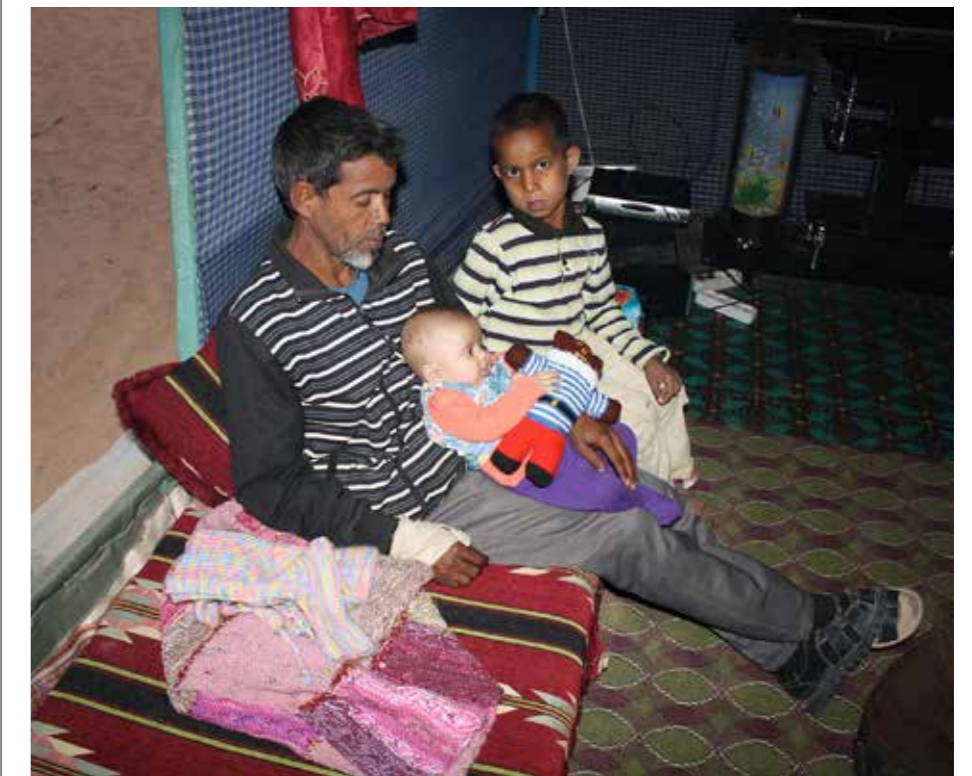
Sidahmed håller i Mana, som håller i en gosenalle gjord av en svensk syförening.