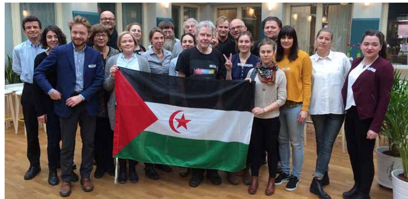
Norska, finska och svenska representanter från 16 stödorganisationer träffades i Stockholm i mars.