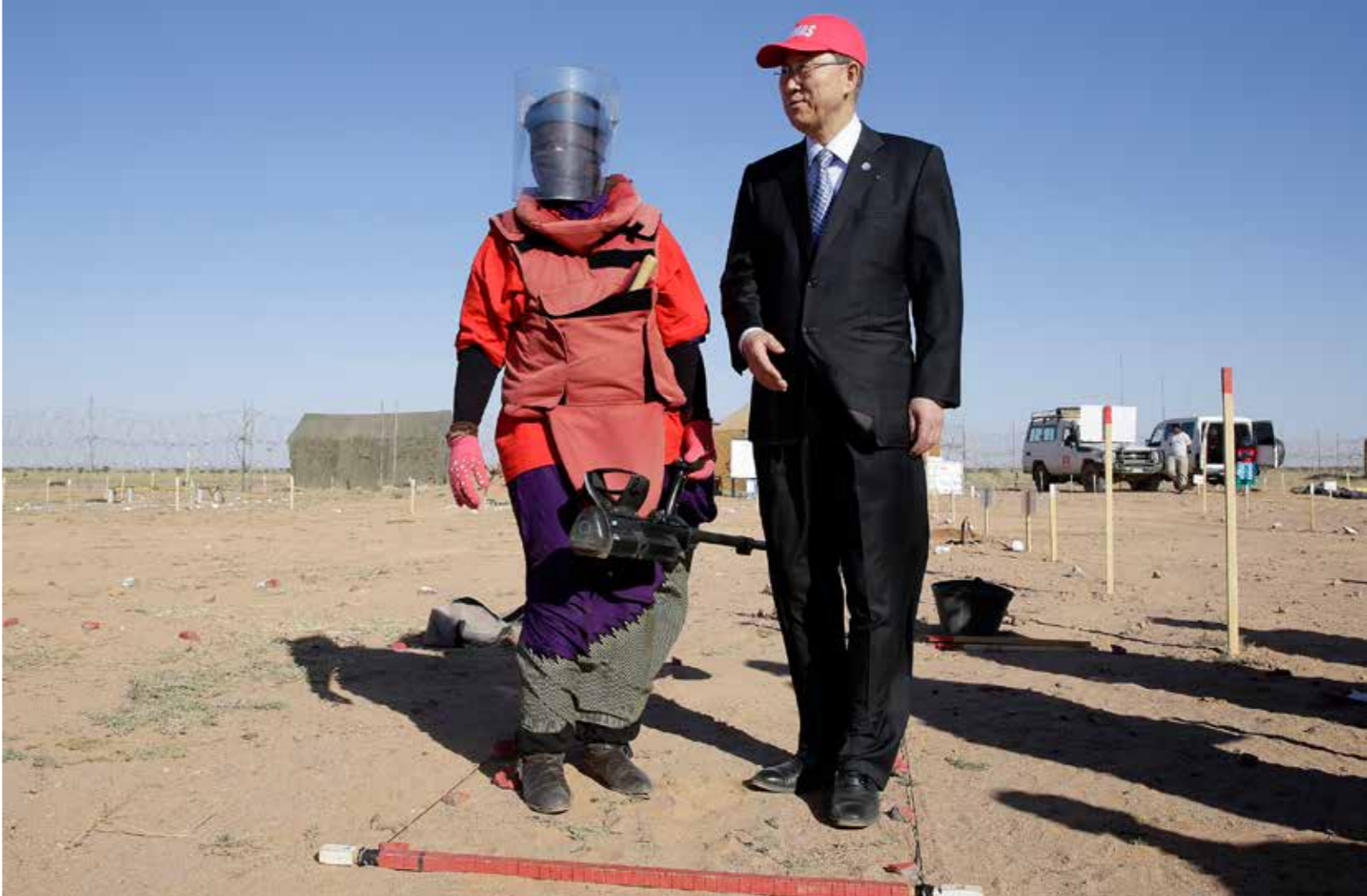
Den Marocko-byggda muren som delar Västsahara i två delar är en av världens mest minerade. FN:s generalsekreterare Ban Ki-moon besöker den östra delen, där en västaharisk minröjerska demonstrerar sitt farliga men viktiga arbete.

hindrat folkomröstningen om självständighet för Västsahara och vägrar sedan 2004 att över huvud taget acceptera ett självständigt Västsahara.