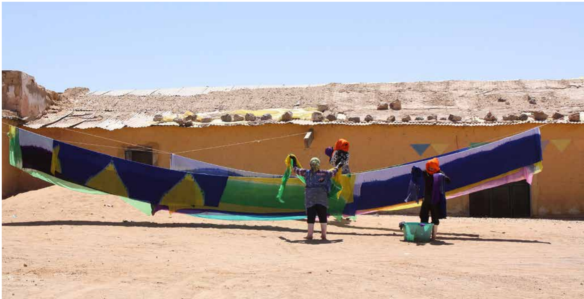
Utanför sykooperativet som stöds av UNHCR, hänger några kvinnor upp långa tygstycken på tork.