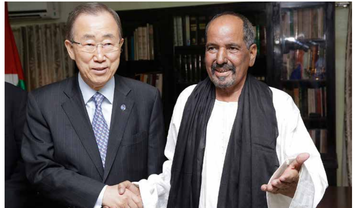
I mars mötte FN:s generalsekreterare Ban Ki-moon Mohamed Abdelaziz i flyktinglägren.