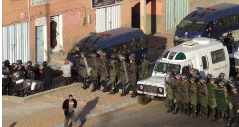
I den ockuperade delen av Västsahara är det förbjudet att uttrycka sympatier för ett självständigt Västsahara – trots att inget land i världen erkänner Marockos rätt till landet.