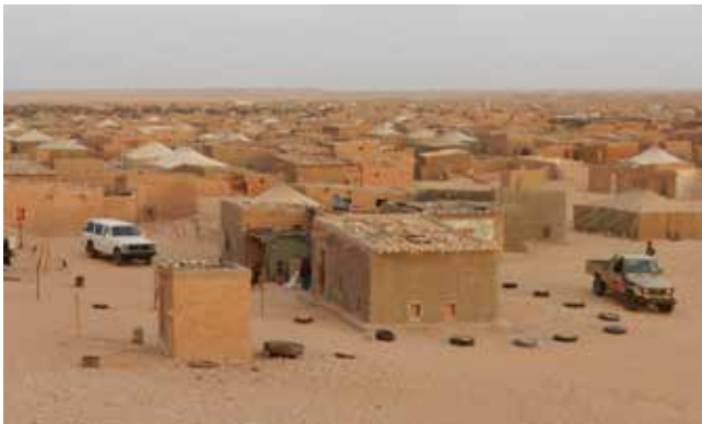
I flyktinglägren i Algeriet börjar nya generationer unga västsaharier tappa tålamodet. De kräver framför allt att omvärlden ska agera.