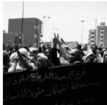
Den första maj demonstrerade västsaharier i El Aaiún. Fem västsahariska elever från skolan Lissan Eddine Elkhatib, som organiserade manifestationen greps senare av marockansk polis, misshandlades och fördes i koma till sjukhuset. Manifestationer ägde också rum i Dakhla och i södra Marocko.