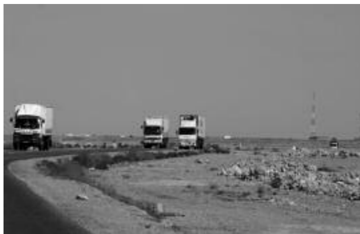
Lastbilar lastade med fisk från El Aaiún på väg mot den marockanska gränsen.