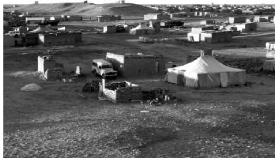
Väst-sahariskt flyktingläger i Algeriet.

Laaroussi: Vid ett tillfälle var det en grupp väst-sahariska människorättsaktivister som skulle resa till Genève för att föra fram sina åsikter. Men när de nådde flygplatsen beslagtogs alla deras dokument och de fördes tillbaka. Det fanns en organisation som kallades för "Sanning och rättvisa", men deras kontor i El Aaiún har stängts. Ingen av dem tilläts att jobba med människorättsfrågor längre. Alla advokater som jobbade i detta forum blev deporterade. De som inte velat ge upp sitt jobb har blivit utfrysade.