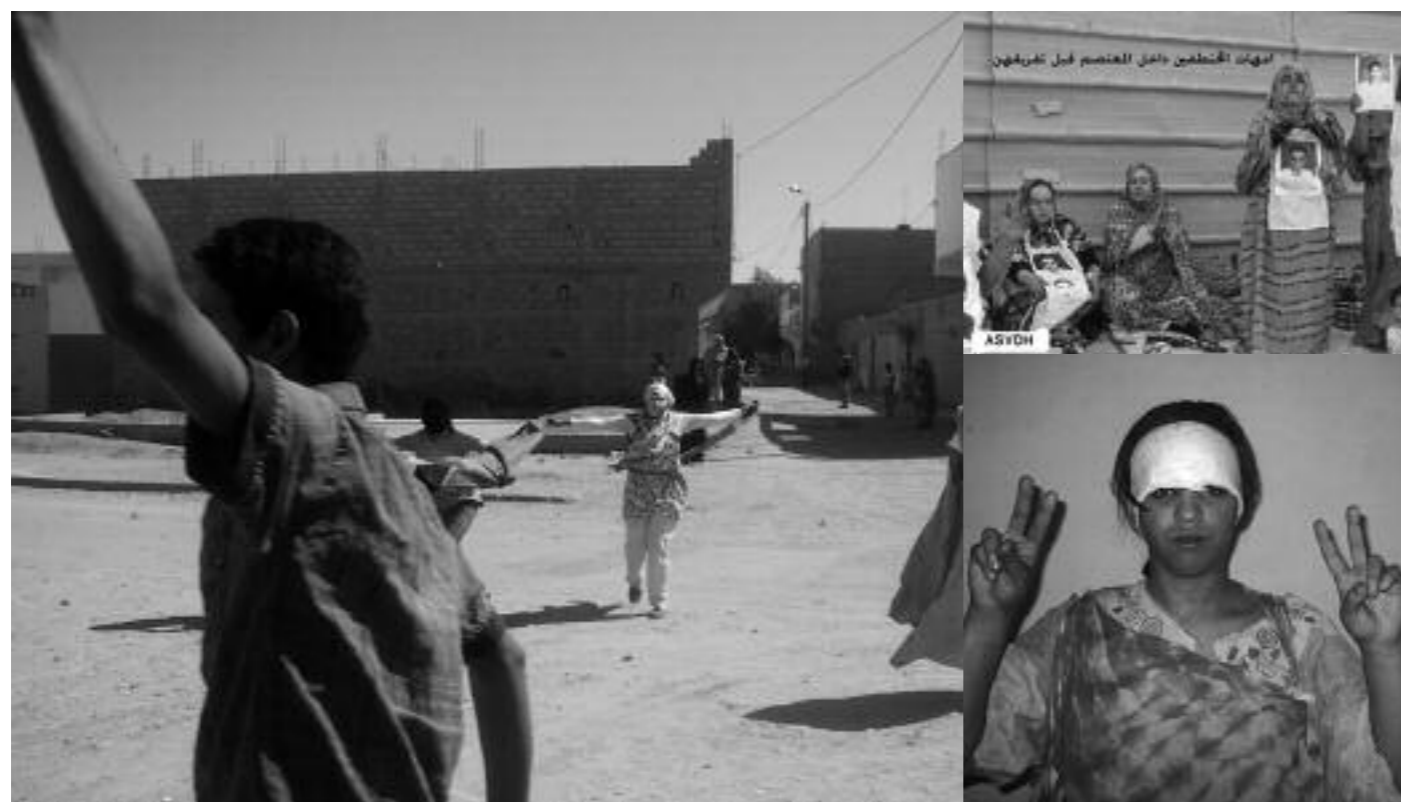
Till vänster: Västsaharier demonstrerar i Smara den 24 mars.

Källor: TT, Reporters Without Borders, Journalisten