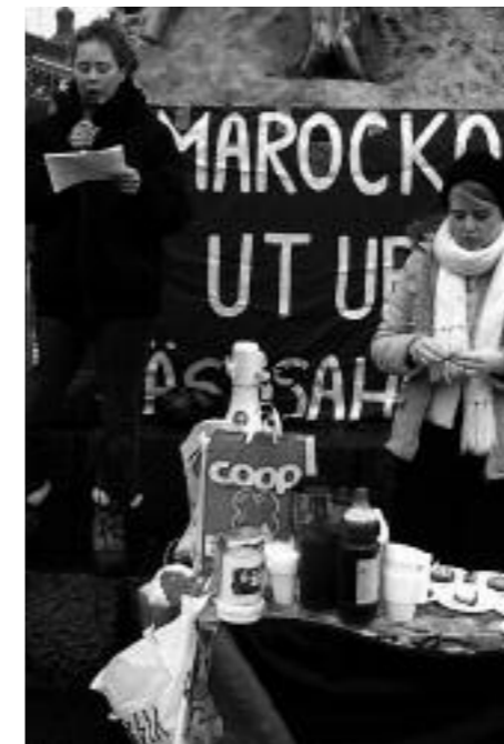
Förbipasserande bjöds på saft och gräddtårter

Den 27 februari i år var det 31 år sedan Spanien lämnade Västsahara och landet