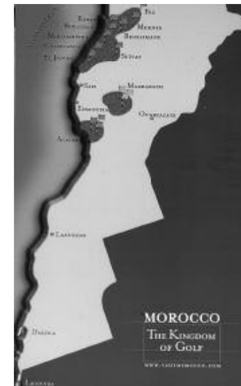
På den statliga turistbyråns karta ingår Västsahara i det marockanska golfriket.