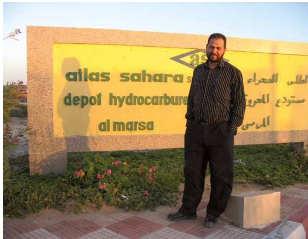
Hit men inte längre. En anställd på Atlas Sahara avvisar vänligt men bestämt.