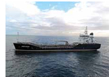
Wisby Argan. Ägare: Wisby Tankers och Atlas Sahara