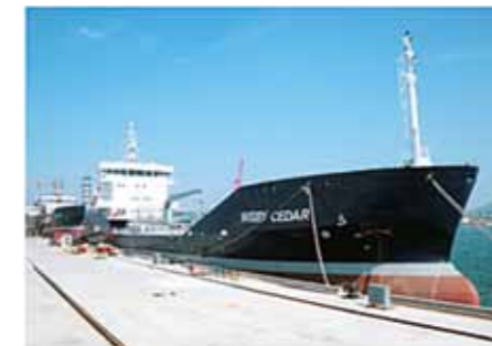
Wisby Cedar. Ägare: Wisby Tankers och Atlas Sahara