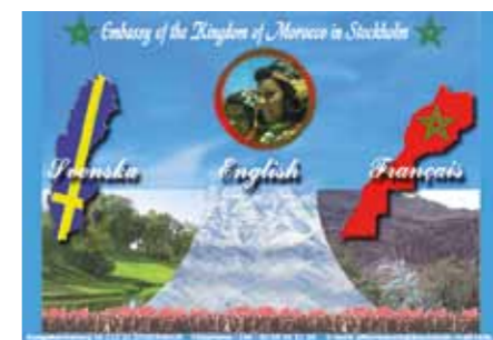
På Marockanska ambassadens karta är Västsahara (”de södra provinserna”) en del av Marocko.

”När det gäller Marockos ambassadör är det vi som kontaktat honom. Han är saharwi från Laayoune och en god vän till familjen sen länge. Vi bad om tips på hassaniska folkmusiker vi kunde kontakta. Vi frågade också om stipendier som kunde hjälpa konstnären att ta sig hit. Ambassadören erbjöd sig att undersöka saken och vi har fått tag på det vi önskat. Vi frågade också om