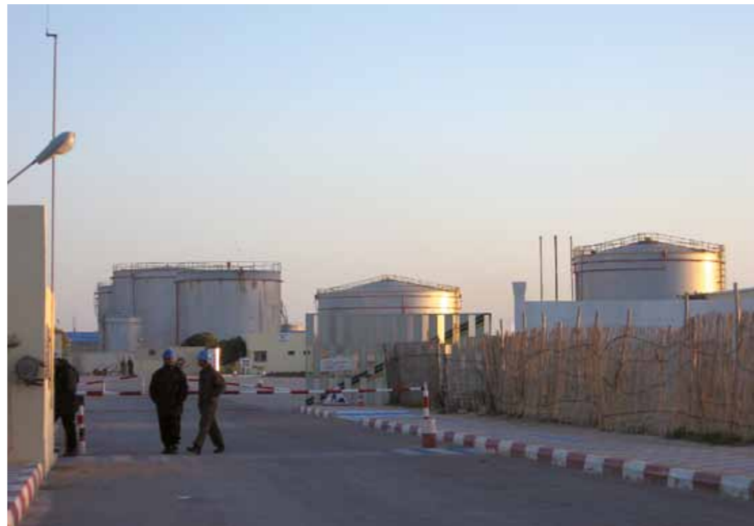
Atlas Sahara i El Aaiúns hamn våren 2008.