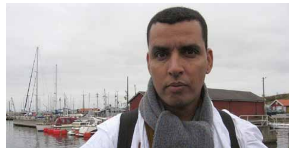
Leaarousi, som flytt från ockuperat område till flyktinglägren besökte Öckerö gymnasieskola i oktober 2012.