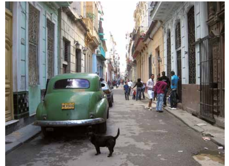
Gatan i Havanna skiljer sig markant från flyktinglägren i Saharas öken.