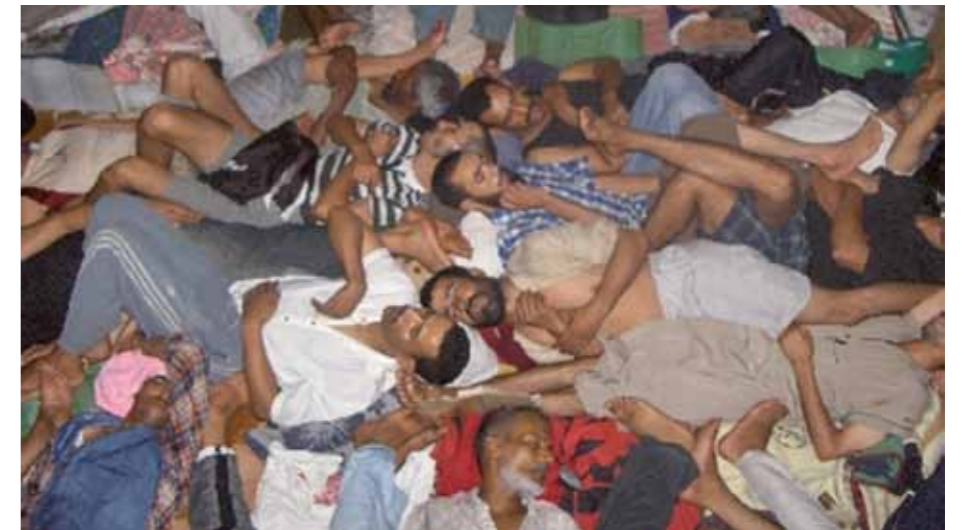
Det överfulla Svarta fängelset i El Aaiún 2005.