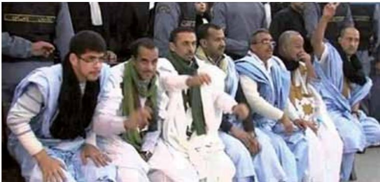
Sju av de 25 dömda västaharierna.