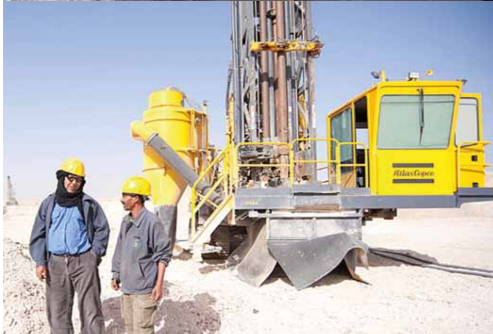
Atlas Copcos borrhutrustning på plats i fosfatgruvan Bou Craa i Västsahara.

Jag får veta att Atlas Copco involverar externa experter och organisationer i sitt etik- och hållbarhetsarbete: