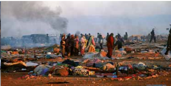
Protestlägret Gdeim Izik stormades 2010 av marockansk polis.