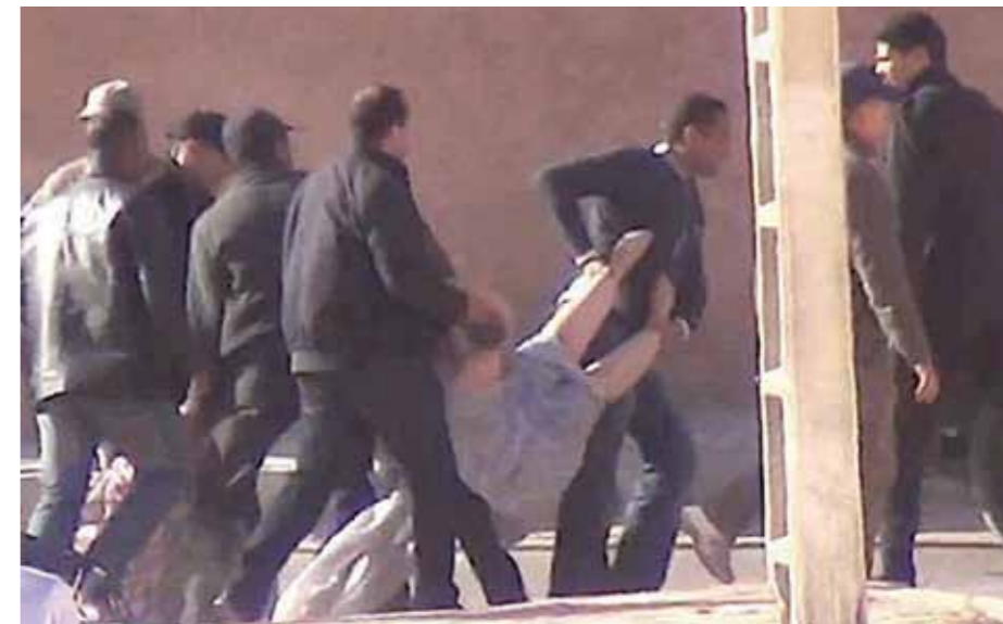
23 mars, i samband med Christopher Ross besök i området, attackerades Sultana och andra kvinnor av civiltklädd polis, när de demonstrerade fredligt.

Mari Dahl Adolfsson En kortare version av artikeln har varit införd i Göteborg Fria.